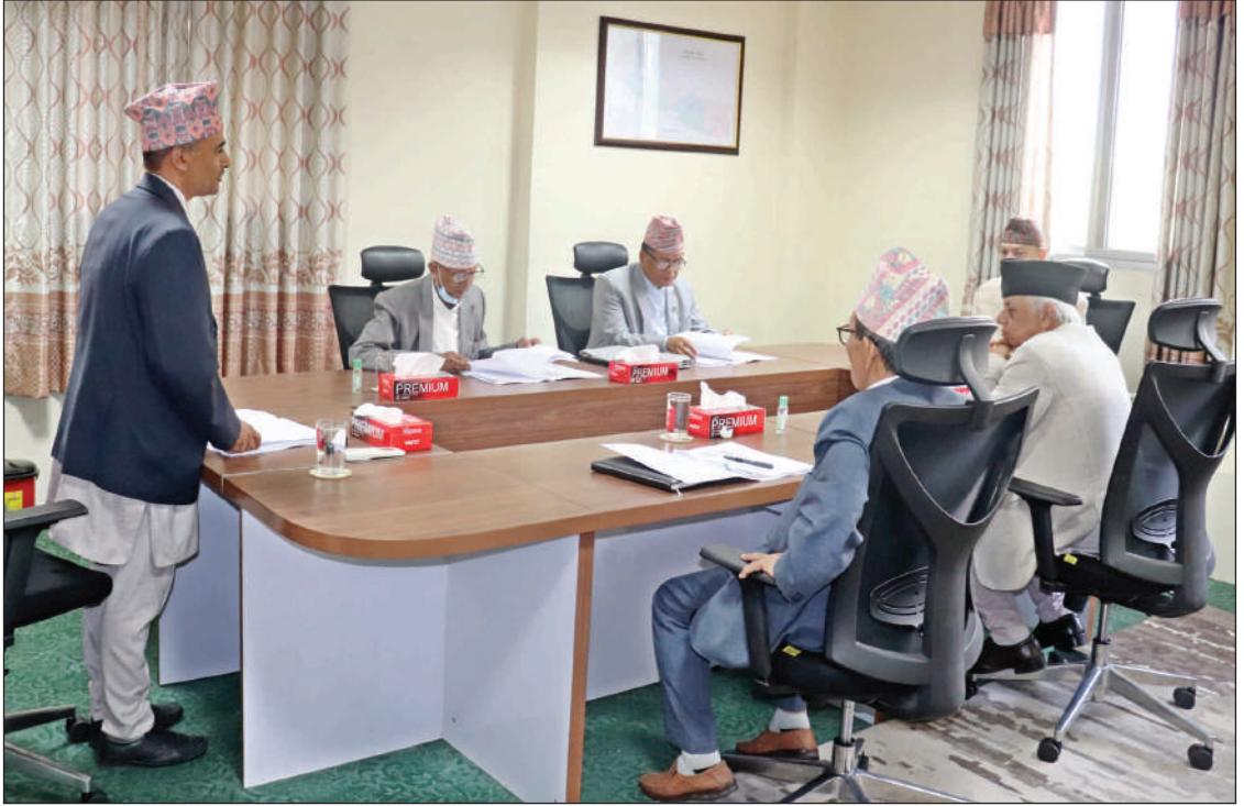
न्याय परिषदको बैठकमा परिषदका माननीय पदाधिकारीज्यूहरू ।